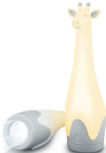
Gina the giraffe