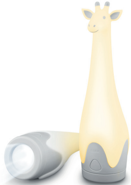
Gina the giraffe