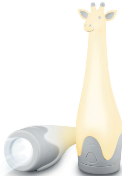
Gina the giraffe